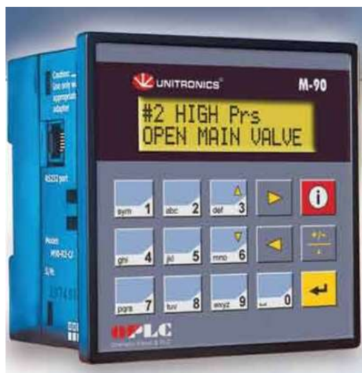
PLC zobrazovací a ovládací jednotka